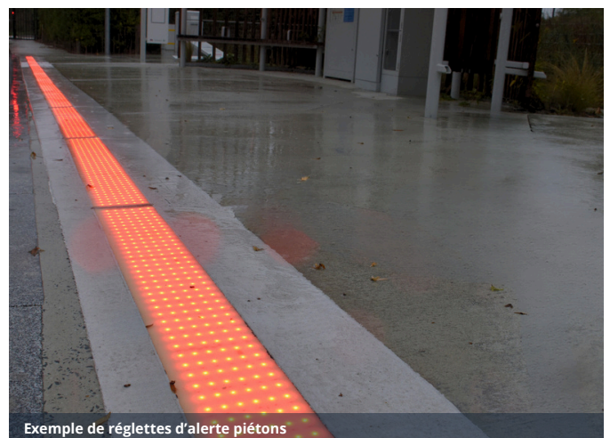
Exemple de réglattes d'alerte piétons