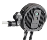
Système de détection intelligent Capteur FLIR TrafOne ou équivalent (en option)