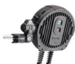
Système de détection intelligent Capteur FLIR TrafiOne ou équivalent En option